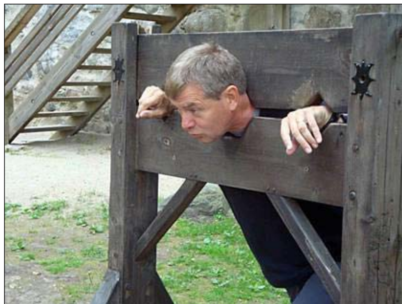
■ Zastupitelé za JDK jsou připraveni bojovat za Jičín a blaho občanů a jsou ochotni za to i mnohé obětovat.